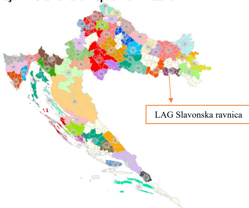
Slika 2: Karta položaja LAG-a na karti Republike Hrvatske