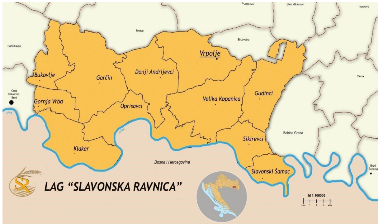
Slika 1: Karta LAG područja s vidljivim granicama JLS-ova u LAG-u

1500. godine. Vrpolje je rodno mjesto jednog od najpoznatijih hrvatskih kipara - Ivana Meštrovića.