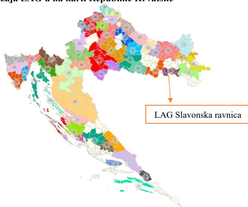
Slika 2: Karta položaja LAG-a na karti Republike Hrvatske