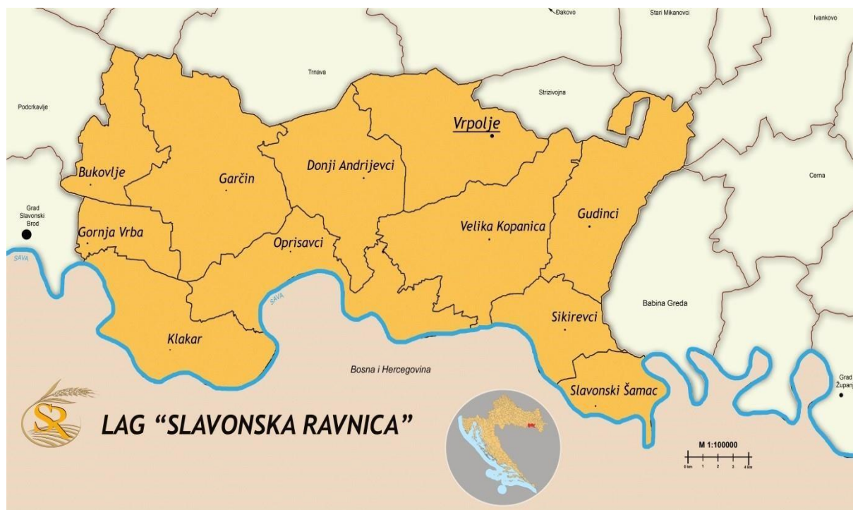
Slika 1: Karta LAG područja s vidljivim granicama JLS-ova u LAG-u