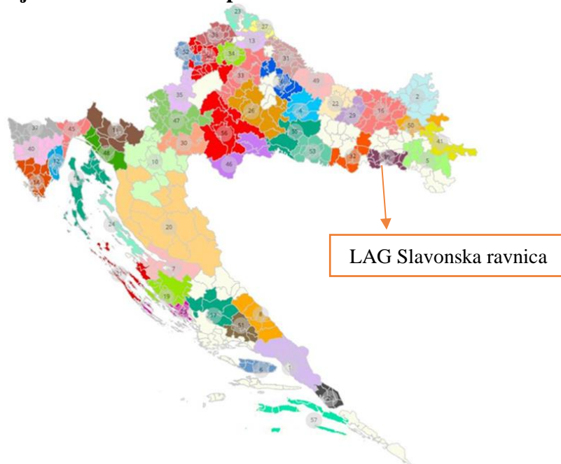
Slika 2: Karta položaja LAG-a na karti Republike Hrvatske